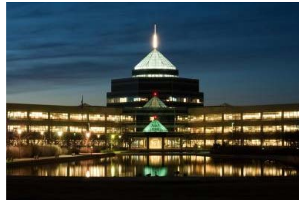
➦ Nach Nortels Auszug aus dem Carling Campus in Ottawa wurden dort Abhörwanzen gefunden.

Nortel ist das wohl komplexeste und, nach Gebühren gerechnet, teuerste Insolvenzverfahren aller Zeiten. Das Konzerngeflecht ist über zig Länder verteilt, wobei unklar ist, was welcher Teilfirma gehört. Sie erheben Forderungen gegeneinander aus konzerninternen Geschäften. Gleichzeitig haben manche Nortel-Gesellschaften für Konzernschwestern gebürgt. Nachdem mehrere Mediationsverfahren gescheitert sind, ist die Aufteilung des Vermögens eine Herkulesaufgabe für die zuständigen Gerichte.