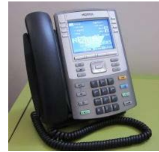
Avaya übernahm Nortel Enterprise Solutions und vertreibt IP-Kommunikation mit Nortel-Ursprung